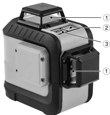
LX-360-2 Red (арт. 35076)